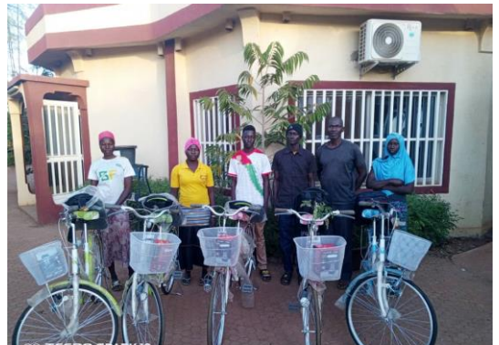
Autres aides reçues : vélos + sacs scolaires pour 5 élèves victimes de maltraitance