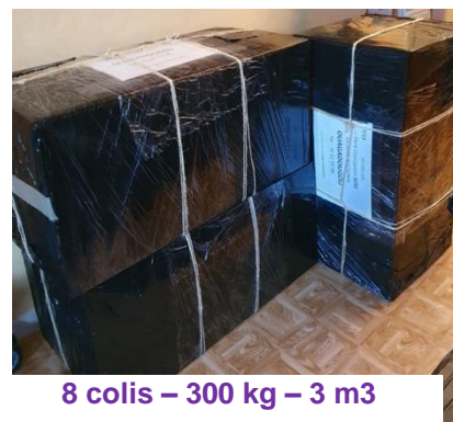
8 colis – 300 kg – 3 m3