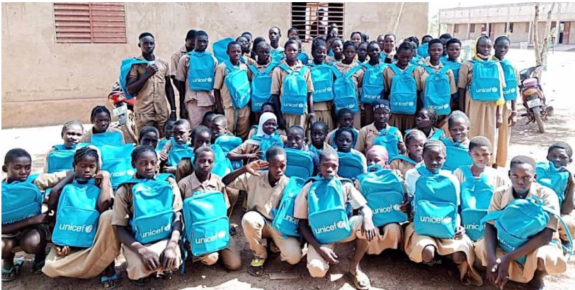
L'Unicef, la Croix Rouge burkinabè ont équipé les collégiens d'un sac à dos avec fournitures scolaires