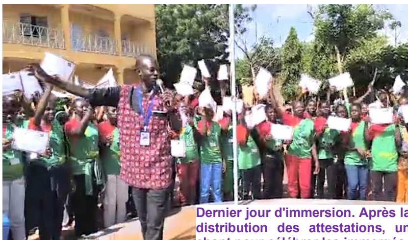
Dernier jour d'immersion. Après la distribution des attestations, un chant pour célébrer les immergés.

⇒ Immersion patriotique : une initiative gouvernementale