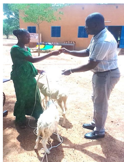
Kit d'installation : une paire de moutons.