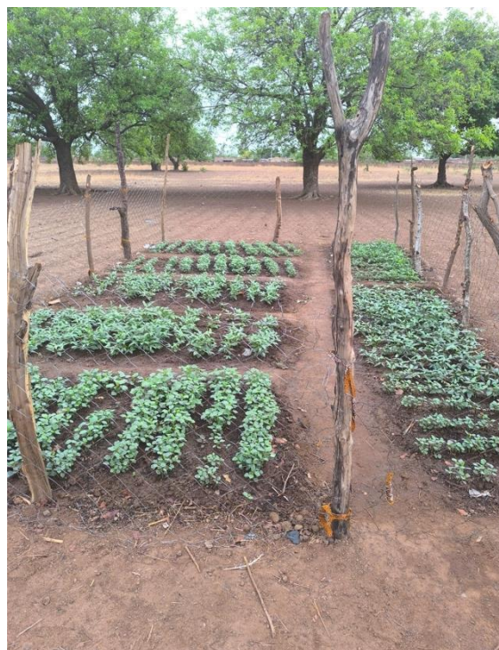
L'école primaire Henri Feder est une école pilote pour la création des jardins potagers