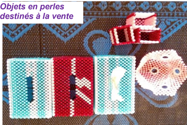
Objets en perles destinés à la vente

⇒ Projet : Mise en place d'une formation à l'élevage de caprins et de volailles