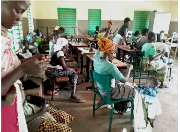
Des chaises sont indispensables : les couturières sont majoritairement assises sur des bancs. Plus de machines permettront un meilleur apprentissage.

En couture, le centre a accueilli ces deux dernières années plus d'une centaine d'apprenantes réparties sur les 3 ans que dure la formation. La salle de couture a été agrandie.