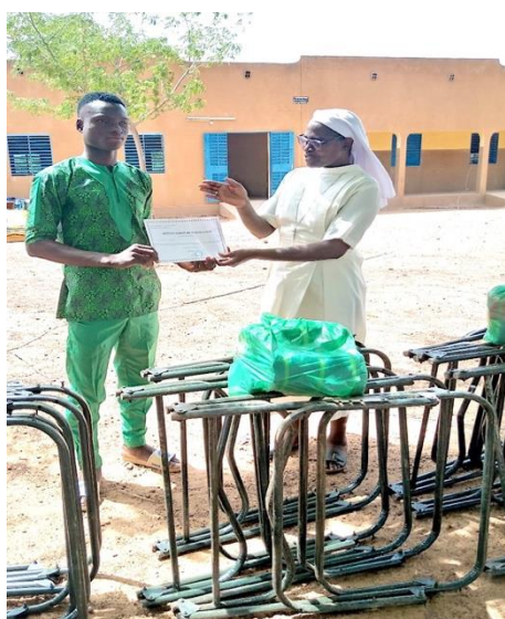
Kit d'installation : 1 cadres de lit picot et 3 paquets de fil.

À l'issue de ses trois années de formation, chaque jeune reçoit une attestation et un kit d'installation.