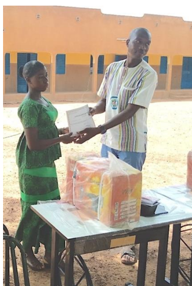
Kit d'installation : une machine à coudre, une paire de ciseaux et un maitre-ruban.