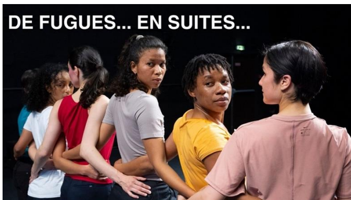
DE FUGUES... EN SUITES...

"La création de " De Fugues ... en Suites... " intervient dans mon parcours de chorégraphe comme une ardente nécessité personnelle, comme l'urgence de faire le point, voire le contrepoint d'où le choix de la musique de Jean-Sébastien Bach qui s'est imposée à moi comme une évidence. Aujourd'hui nous nous parlons, certes mais est-ce que nous nous entendons ? Le fil conducteur de « de fugues en suites » tient autour de cette question à savoir se parler et s'entendre dans le vacarme de ce monde en crise, en guerre, en folie."