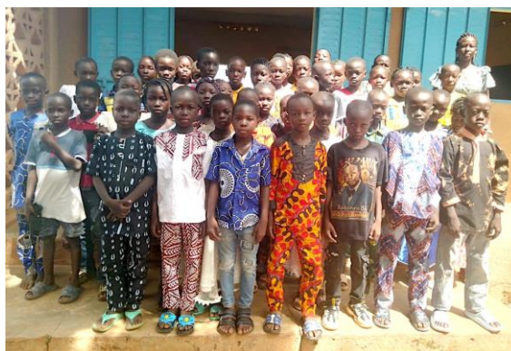
Rentrée des classes à Tougan

La participation des ADD à ce projet s'élève à : 13 573 euros .