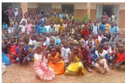
Jour de rentrée à Houndé

Malgré le contexte et la complexité des situations, le nombre d'élèves est cette année de 2 809, soit 338 élèves supplémentaires qui bénéficieront de la cantine.