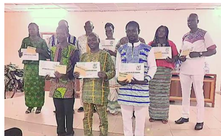
Pour écouter la chanson des enseignants pour la Journée de l'Excellence, cliquez ICI

Participation des amis de Dédougou pour offrir à 2809 enfants 1 repas par jour d'école, de mi-octobre 2024 à mi-janvier 2025.