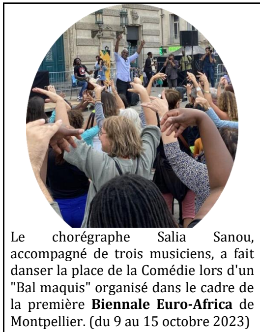
Le chorégraphe Salia Sanou, accompagné de trois musiciens, a fait danser la place de la Comédie lors d'un "Bal maquis" organisé dans le cadre de la première Biennale Euro-Africa de Montpellier. (du 9 au 15 octobre 2023)

Son travail intègre l'héritage de la danse africaine et de la danse contemporaine européenne.