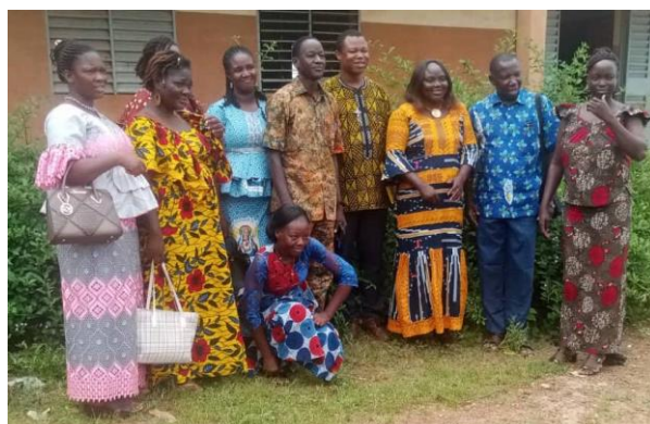
Ste Thérèse de l'enfant Jésus, Houndé